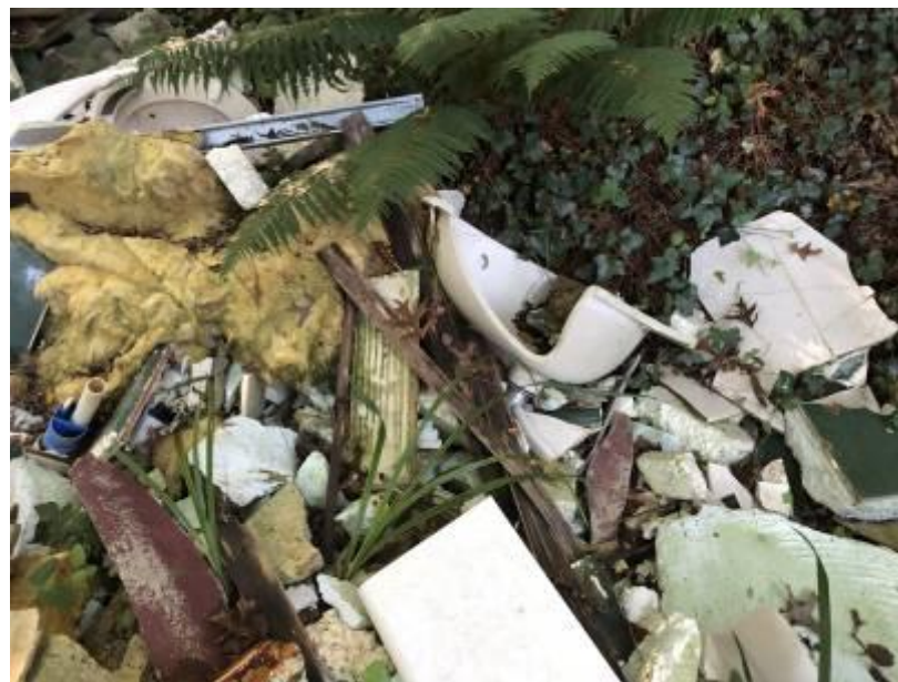
Présence d'amiante ciment