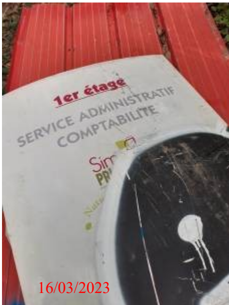
Photo du 16 mars: sucette dont on pourrait peut être identifier l'origine.