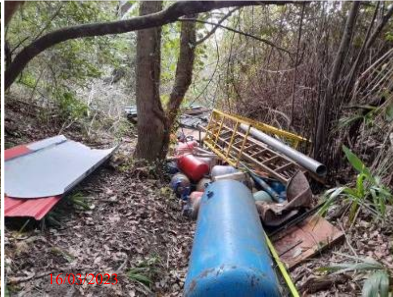
Photo du 16 mars