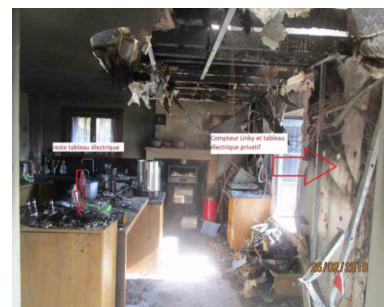
Photo extraite du rapport d'expertise sur l'incendie de Langoiran.

En février 2019, à Langoiran, en Gironde, un incendie s'est déclenché dans une maison. L'incendie aurait pu être dramatique. « Pendant le petit déjeuner avec mes deux enfants en bas âge, les crépitements ont commencé puis un feu s'est déclenché qui a progressé dans la cuisine. Nous sommes sortis en catastrophe, les pompiers sont intervenus en vingt minutes, quand le feu gagnait l'étage. Si le feu avait pris deux heures plus tôt, pendant la nuit, ç'aurait été dramatique » , confie la victime.