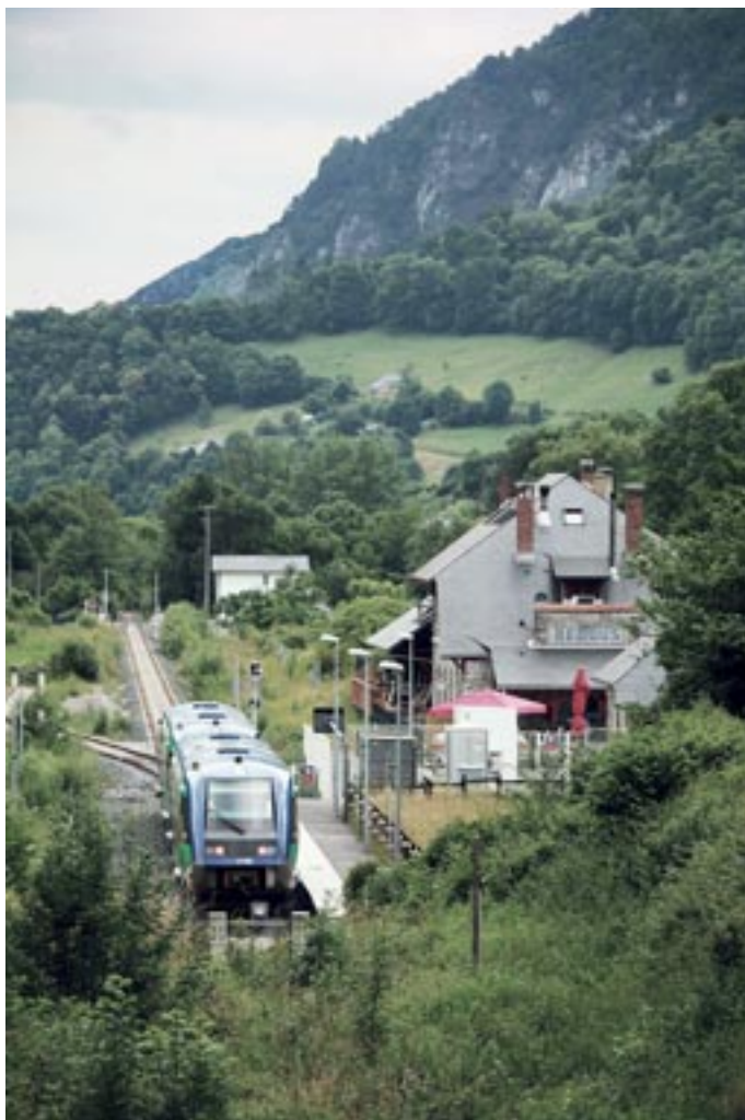
En gare de Bedous le 19 juin 2020, un autorail X73500 s'apprête à descendre sur Pau. Le butoir au premier plan marque le début des 33 kilomètres restant à rouvrir jusqu'à Canfranc, © A. C.-P.