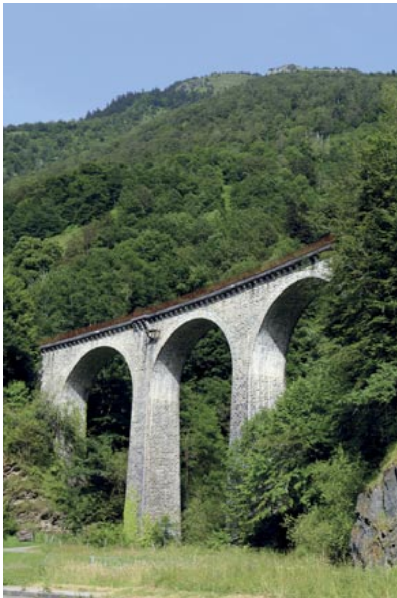
Le viaduc en courbe d'Arnousses (113 mètres de long, 38 mètres de haut, rampe 4,3%) se situe à la sortie sud du tunnel hélicoïdal de Sayerce en haute vallée d'Aspe, juillet 2015, © Gérard Lopez - CRÉLOC