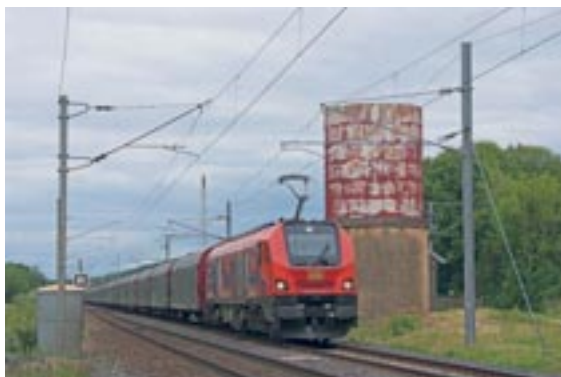
Locomotive bimode Eurodual CC 6001, du constructeur Stadler

À toutes les échelles, le chemin de fer Pau-Saragosse permettra une structuration cohérente des territoires. Train du matin et du soir pour les actifs et les scolaires, trains du marché hebdomadaire et des sorties en montagne, trains grands parcours à travers la montagne, relieront les vallées d'Aspe et de l'Aragon, au reste de l'Europe ferroviaire. Ils constituent dorénavant des vecteurs majeurs de l'aménagement des territoires, dans le cadre de la nouvelle donne économique et bioclimatique.