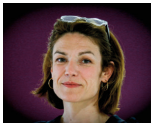
Chantal Jouanno Présidente de la Cndp