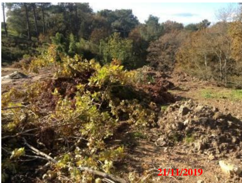
Arbres récemment abattus