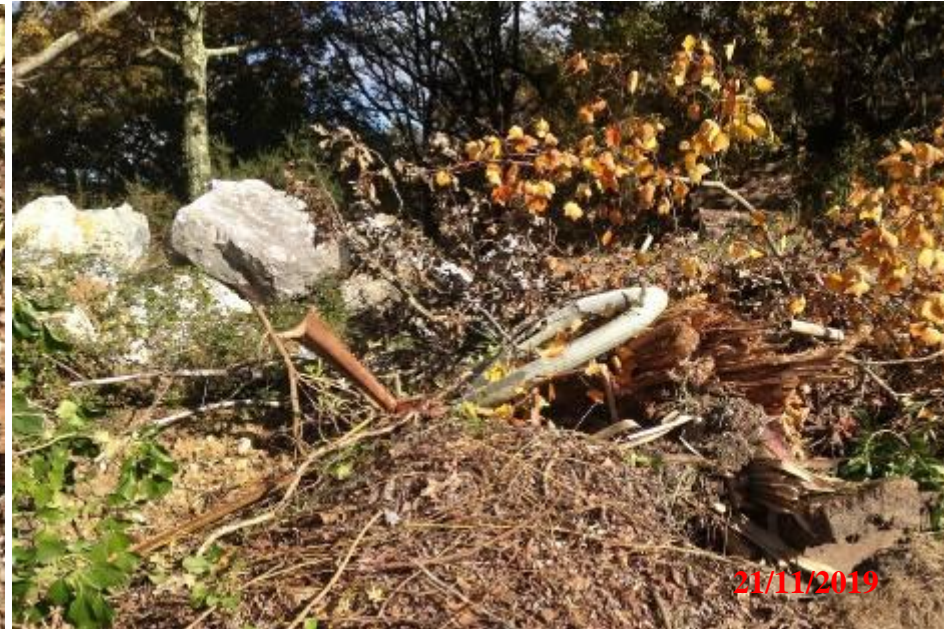
tuyaux et barre de fer.