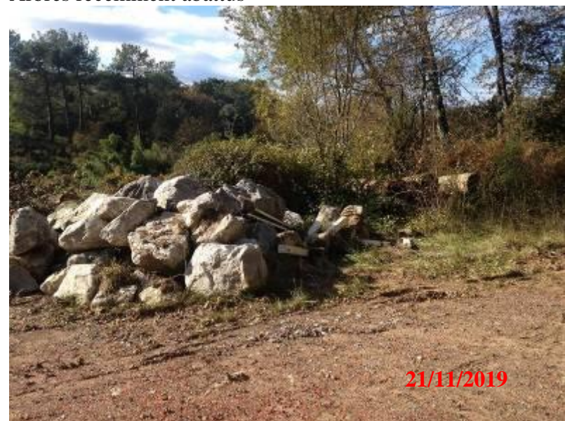
Blocs et arbres coupés