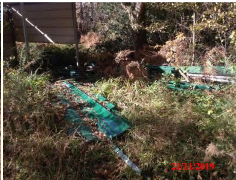
bois et plastiques