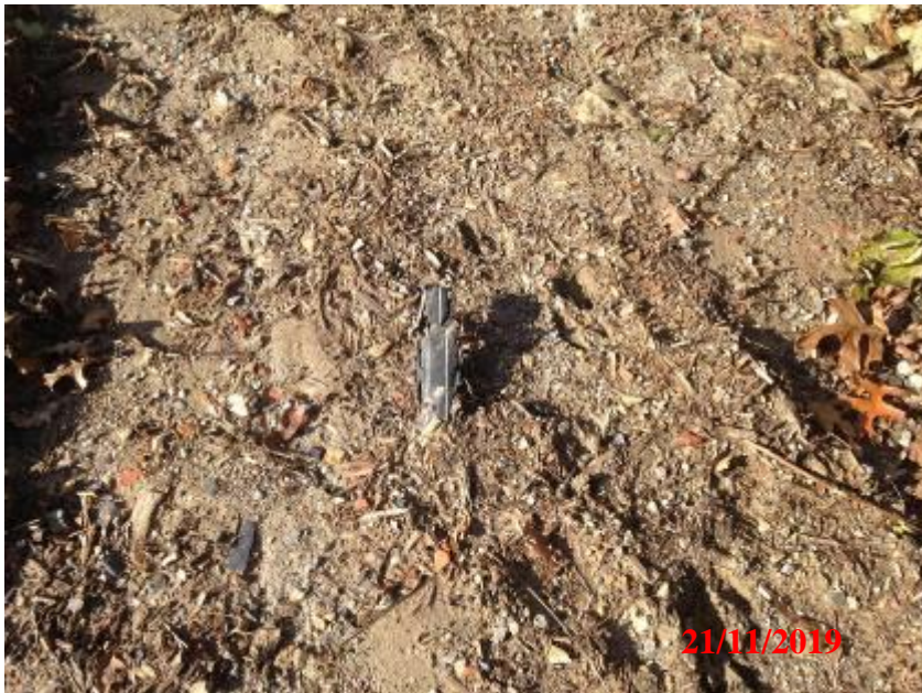
Bout de plastique apparent