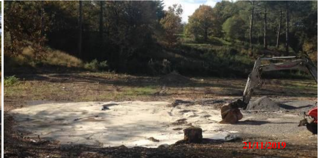
Engin de chantier devant une curieuse bache géotextile.