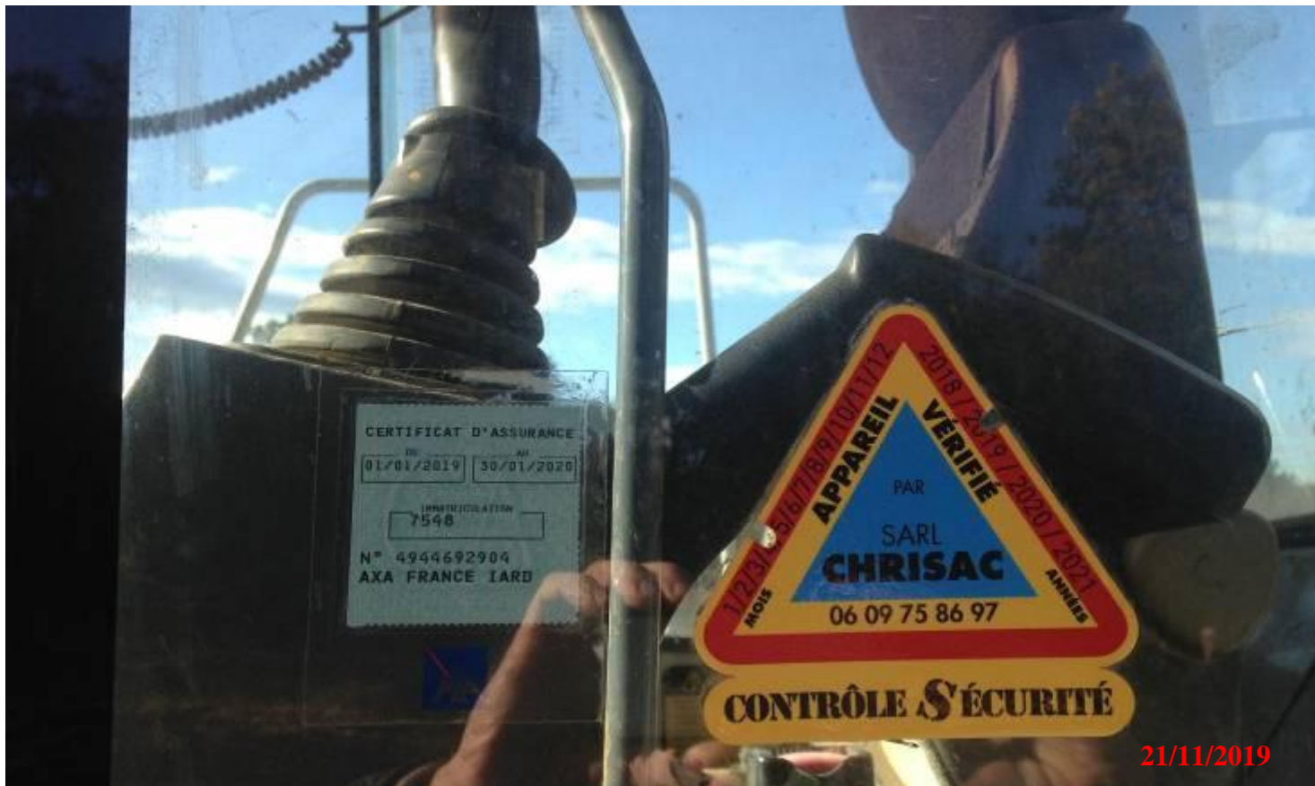
Eléments d'identification de l'engin du chantier.