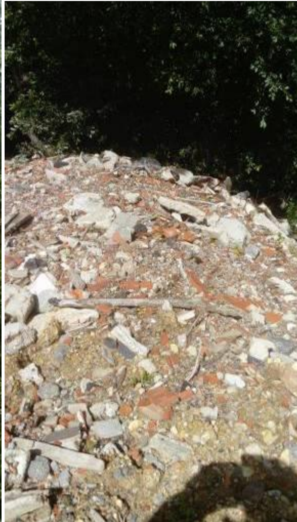
Déversements vus du haut.