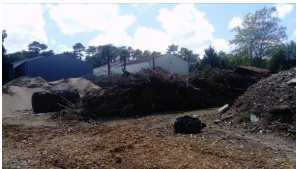
Arrière de l'entreprise. A noter qu'il a été remarqué des feux sur le site.