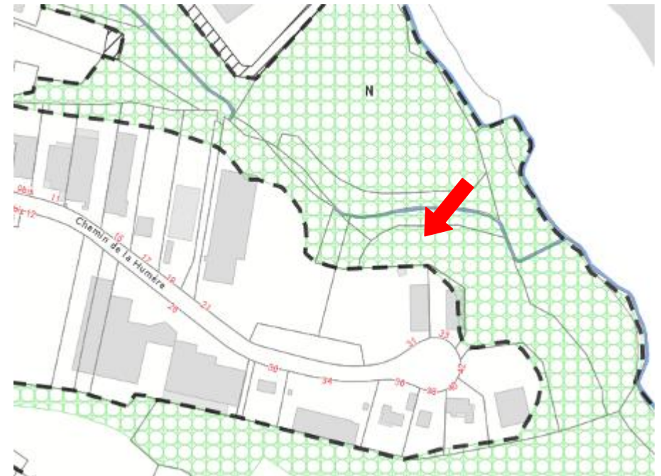
PLU Bayonne: Zone naturelle et bois classés.