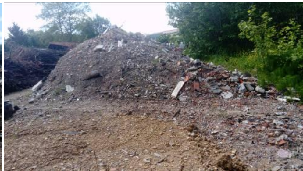
Déchets prêts à être poussés dans le talweg.