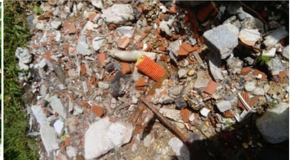
Détail des déchets