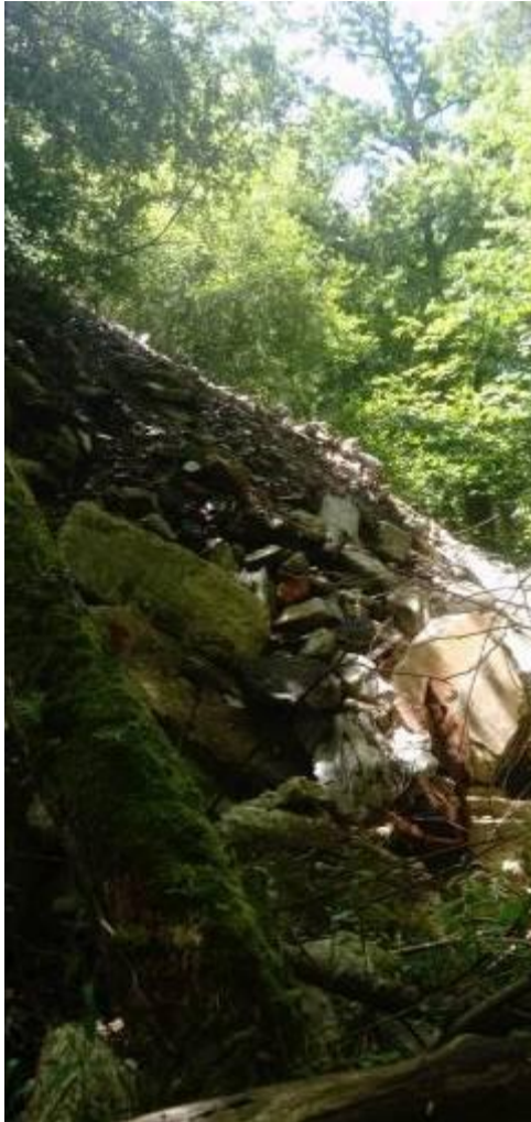
Pied du déversement.