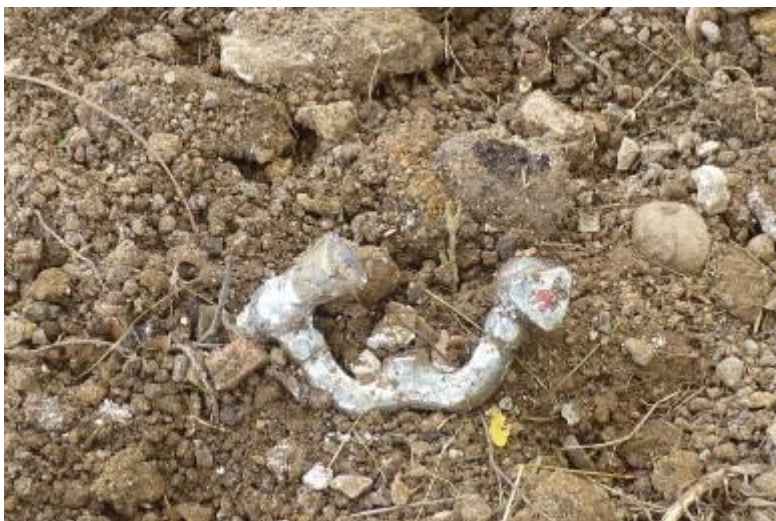
Robinets de salle de bain.