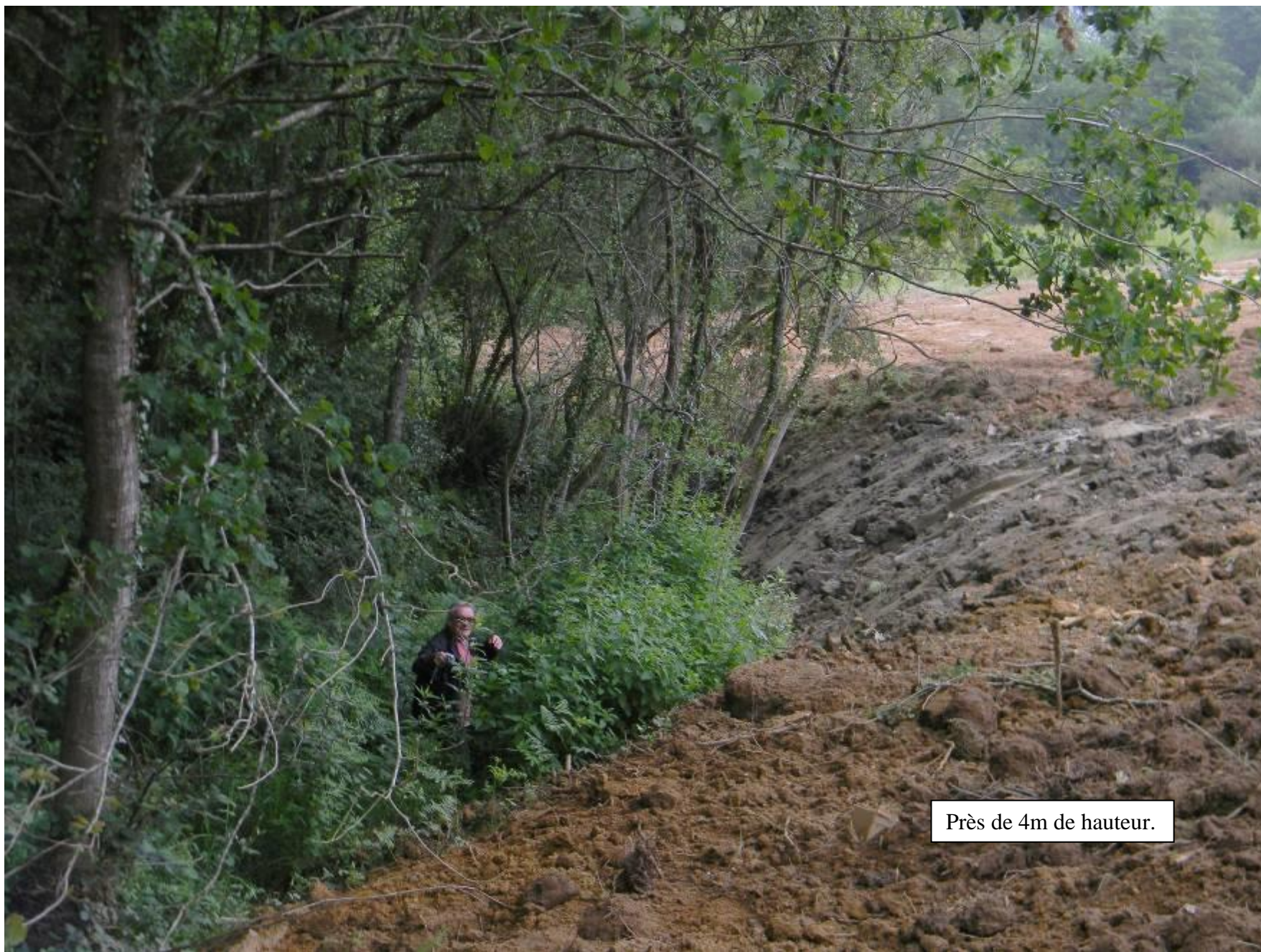
Près de 4m de hauteur.