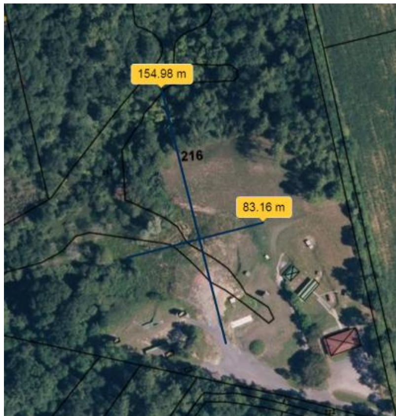
Axes des coupes du dossier Sallaberry