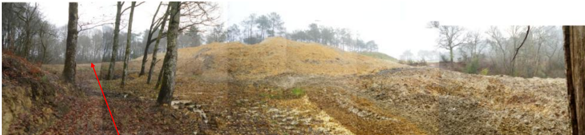
Ex naissance du ru aujourd'hui remblayée