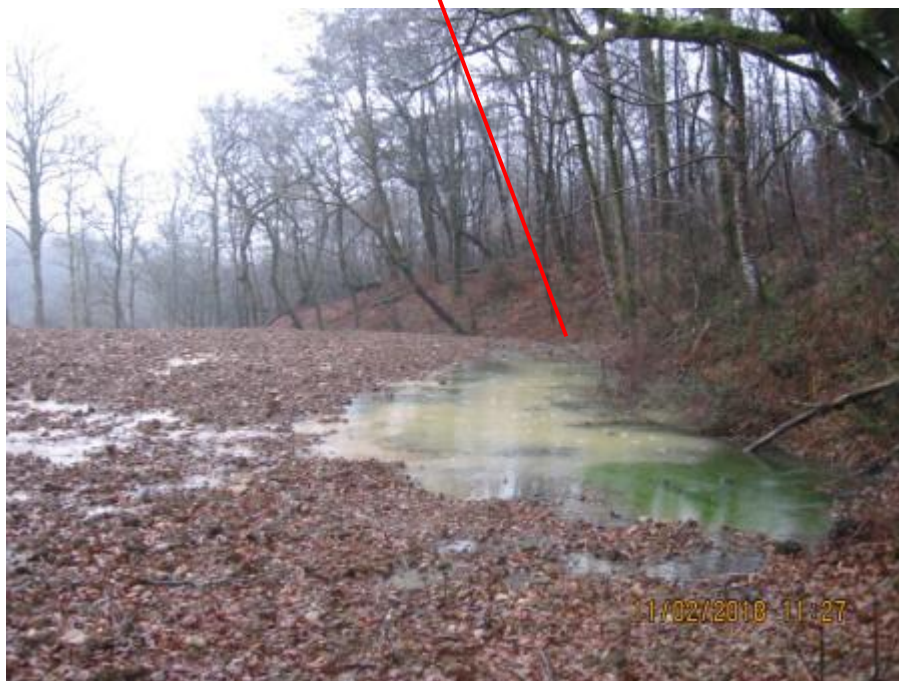
Le ru qui cherche sa voie