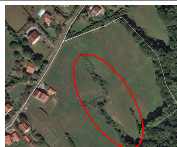
Coulée verte au 16.5.2014

1.418212852206421_43.379943511946738&e=17&id=GEOPORTAIL:OGC:WMTS11&i1=ORTHOIMAGERY,ORTHOPHOTOS;GEOPORTAIL:OGC:WMTS11&i2=HYDROGRAPHY;HYDROGRAPHY;GEOPORTAIL:OGC:WMTS11&i3=PROTECTEDAREAS,SIC;GEOPORTAIL:OGC:WMTS11&i4=TRANSPORTNETWORKS,ROADS;GEOPORTAIL:OGC:WMTS11&i5=GEOGRAPHICALNAMES,NAMES;GEOPORTAIL:OGC:WMTS11&i6=CADASTRALPARCELS,PARCELS;GEOPORTAIL:OGC:WMTS11&permalink=eyes