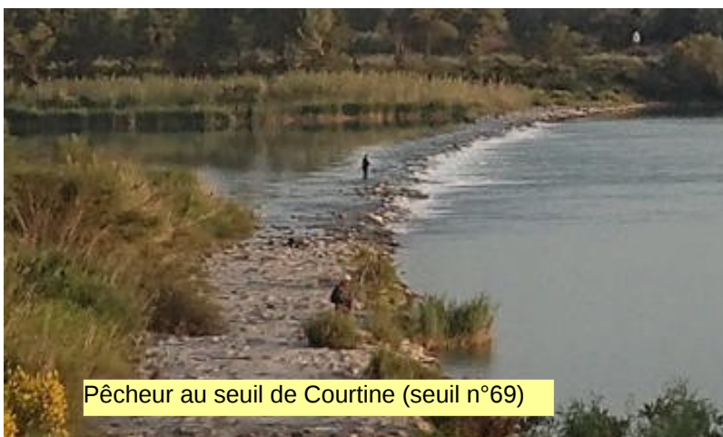
Pêcheur au seuil de Courtine (seuil n°69)

Nous insistons donc : notre Big Jump Durance 2017 (en aval de Mallemort) n'inclut aucune baignade. Toute baignade d'un participant de notre Big Jump sera considérée comme sauvage et faite sous la seule responsabilité du baigneur !