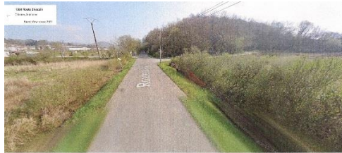
CHÉMIN DE MAMISSOU À DROITE EN PARTANT DE CIBOURE