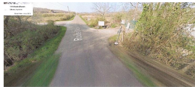
CHENÉ DE MAMISSOUM A GAUCHE EN VENANT D'ASCAIN