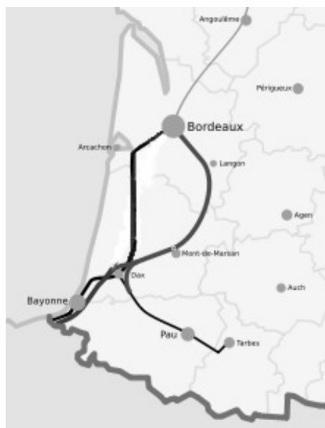
La ligne actuelle en Aquitaine (à l'ouest) et la nouvelle ligne (à l'est)

La gare de Bayonne sera donc desservie (tout comme aujourd'hui) par les TGV nationaux jusqu'à Hendaye. Ils marqueront un arrêt à Biarritz et à Saint Jean-de-Luz (la voie actuelle étant en continuité avec le réseau espagnol à Irún). En revanche, la nouvelle ligne à grande vitesse sera raccordée à la frontière à Biriatoú (et non à Hendaye), là où pourrait déboucher, dans un deuxième temps, le réseau ibérique « à haute prestation » (220 km/h) dénommé « Y basque » (en fait, le réseau ibérique aboutit à ce stade à Irún qui voit sa gare totalement modernisée).